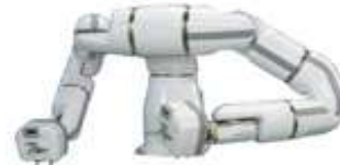
バイオメディカル用途双腕ロボット MOTOMAN-BMDA3