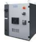
ロボットコントローラ DX200