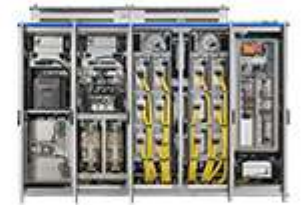
太陽光発電用 パワーコンディショナ