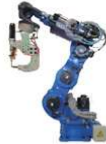
スポット溶接ロボット MOTOMAN-VS100