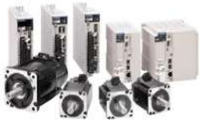
AC サーボドライブ \Sigma -7シリーズ& マシンコントローラ MP3300