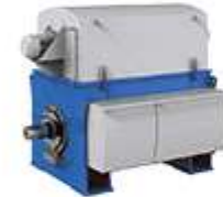
大型風力発電用発電機/コンバータ