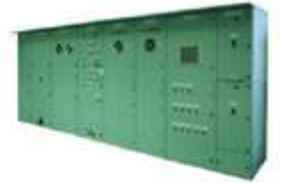
船舶用コンバータ盤 (A1000/D1000)