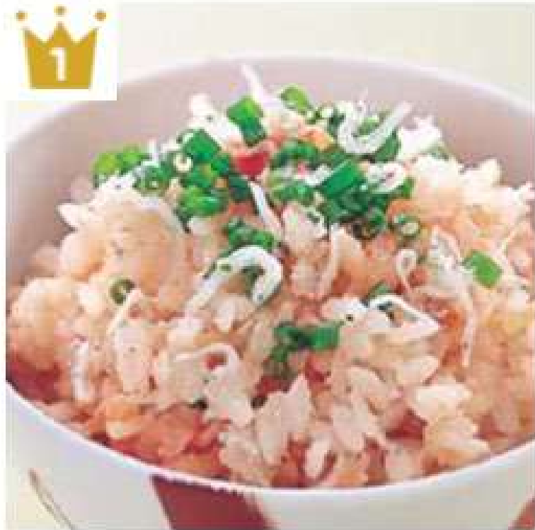
明太炊き込み御飯