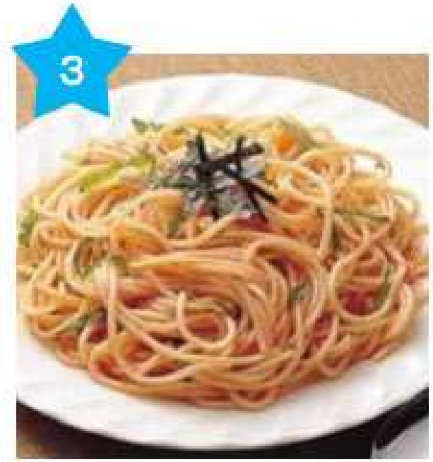
めんたいスパゲティ