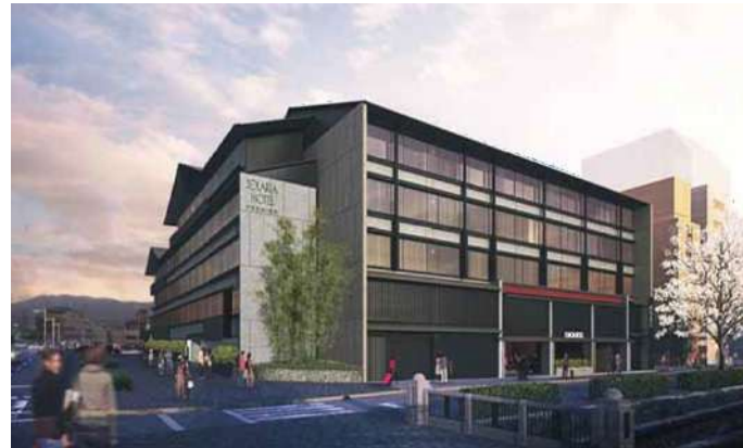
ソラリアホテル京都