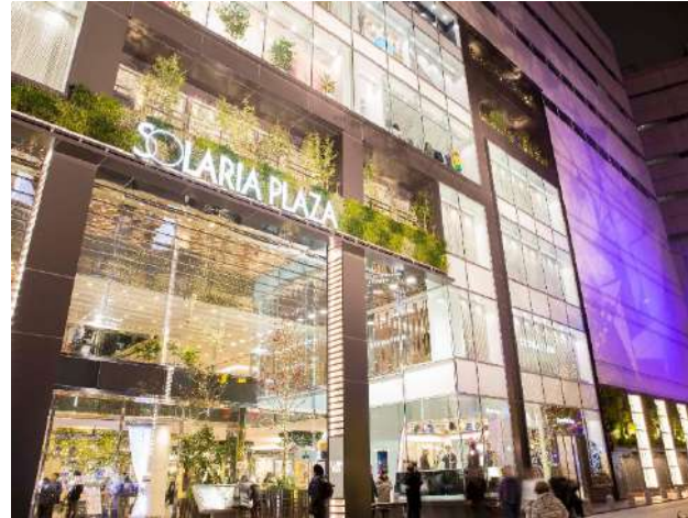
ソラリアホテル京都